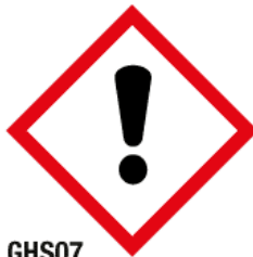
GHS07 Toxicité aiguë catégorie 4 (corrosion, irritations ou sensibilisation oculaires / lésions oculaires) (DA)