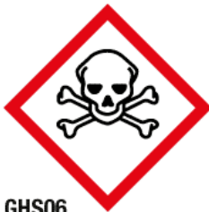
GHS06 Toxicité aiguë catégorie 1, 2, 3 (TO)