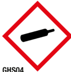
GHS04 Gaz sous pression (GZ)