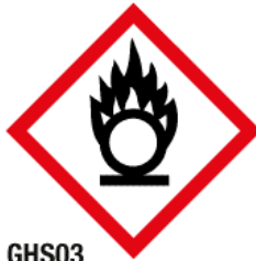
GHS03 Matières comburantes (CB)