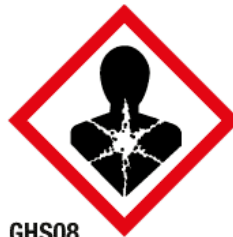
GHS08 Risque mutagène, respiratoire, cancérigène ou pour la reproduction (MU)