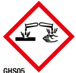
GHS05 Matières corrosives (CR)