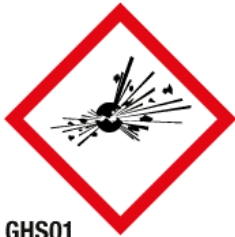
GHS01 Matières explosibles (EX)