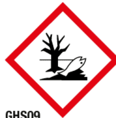
GHS09 Danger pour le milieu aquatique (EN)