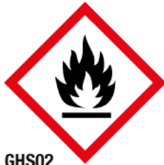
GHS02 Matières inflammables (IN)